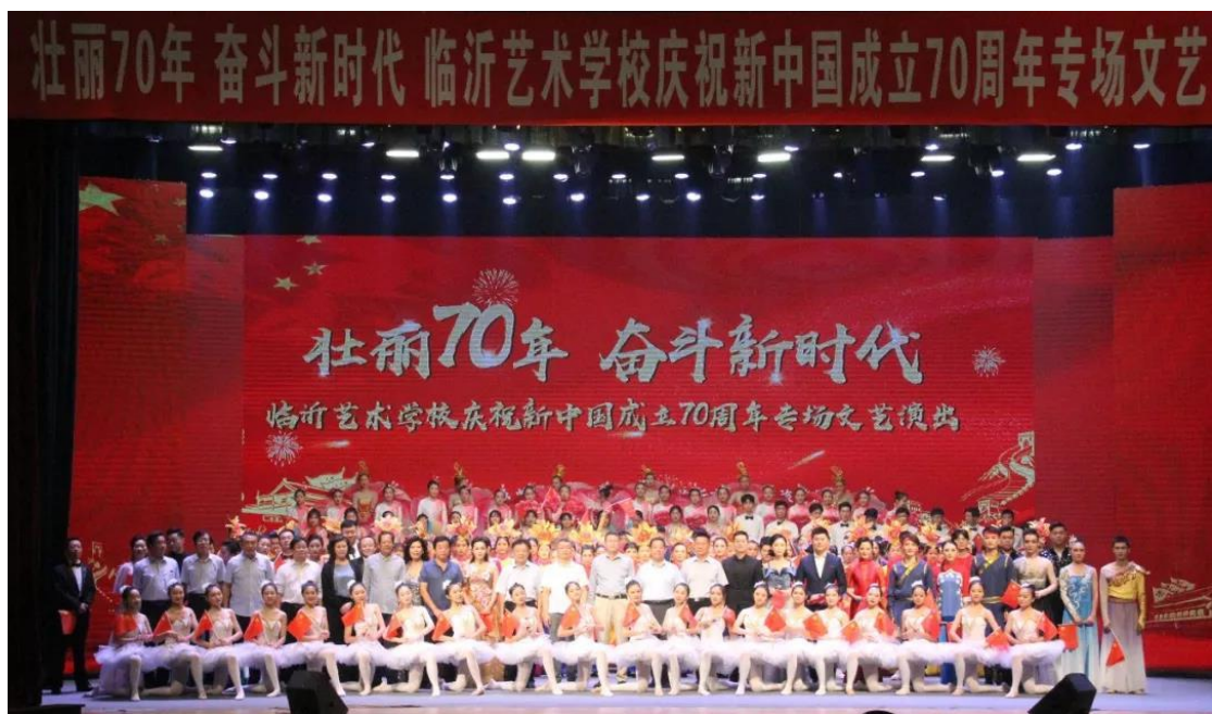
图 5-5：“壮丽 70 年 奋斗新时代”庆祝新中国成立 70 周年专场文艺演出

此外，近年来，我校先后与韩国灵山大学、齐鲁师范学院、广东省旅游学校、华航航空学校、潍坊教育学院、临沂大学等学校签订了《联合办学协议》，合作培养专业技术人才。在此基础上，学校为每位毕业生提供一定实习就业机会，先后与临沂市蒙山沂水演艺有限公司、临沂华泰建筑公司、临沂市歌舞剧院、临沂沂南马牧池影视基地等几十家单位建立了学生实习合作关系，采用“带薪实习”、“订单培养”等模式，将学校的实习与就业联为一体，输出符合用人单位需求的技能人才。据统计，本年度各用人单位对学校毕业生的满意率高达 100%，形成了“招得进，学得专、出得去、用得上”的良好局面。