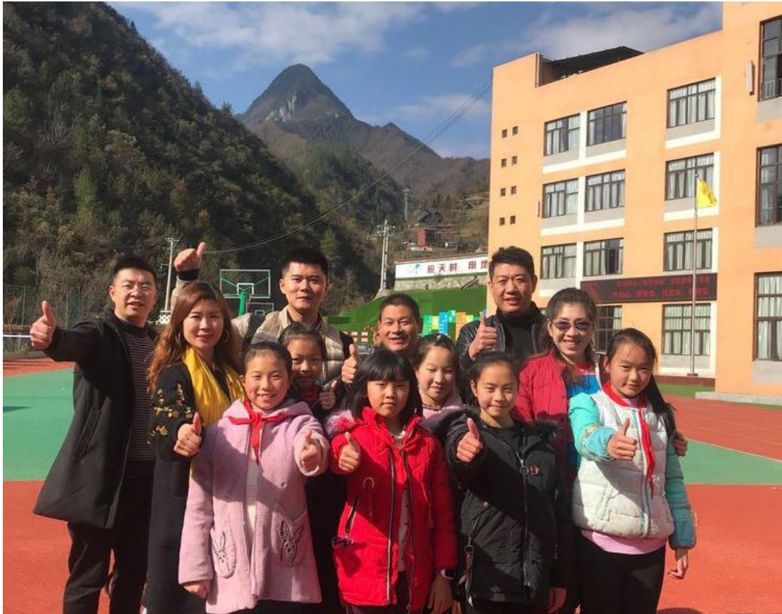
图 5-7：临沂市教育局名家朗诵团赴重庆城口县 7 所学校送教活动