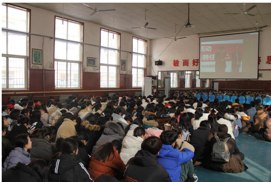
图 2-3：法制进校园活动