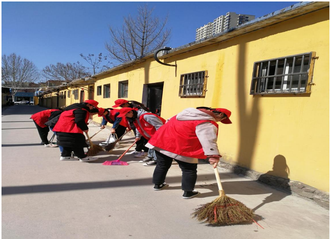
图 2-9：创建文明城市志愿服务活动