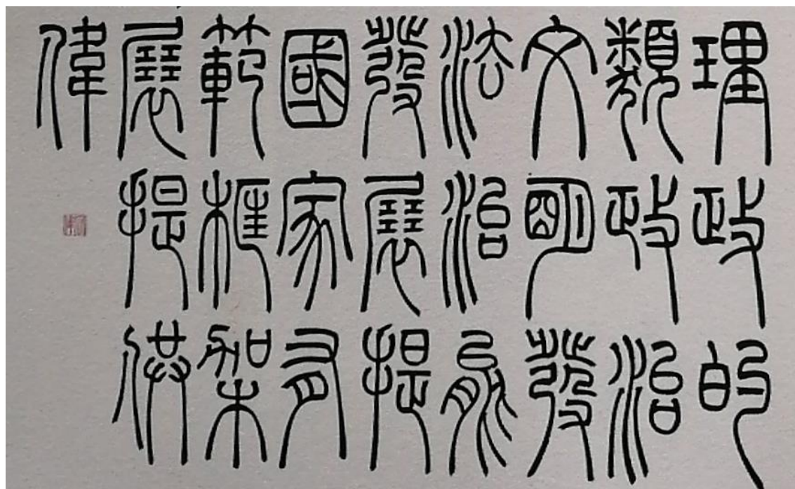
图 5-3：书法教师作品剪影