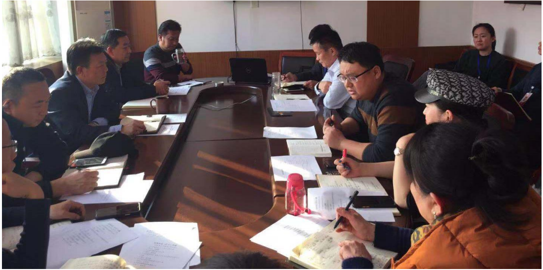
图 3-6：党总支会议、校务会议

二是强化日常党建工作管理。按照要求严格执行“三会一课”、主题党日等活动，创建优秀支部工作法，打造学校“阳光润的 向日而升”党建品牌，认真落实市教育局党建“151”工程，以教育系统规范化支部建设为引领，充分发挥党员的先锋模范作用，服务于学生成人成才，保证了党的建设得到不断加强。