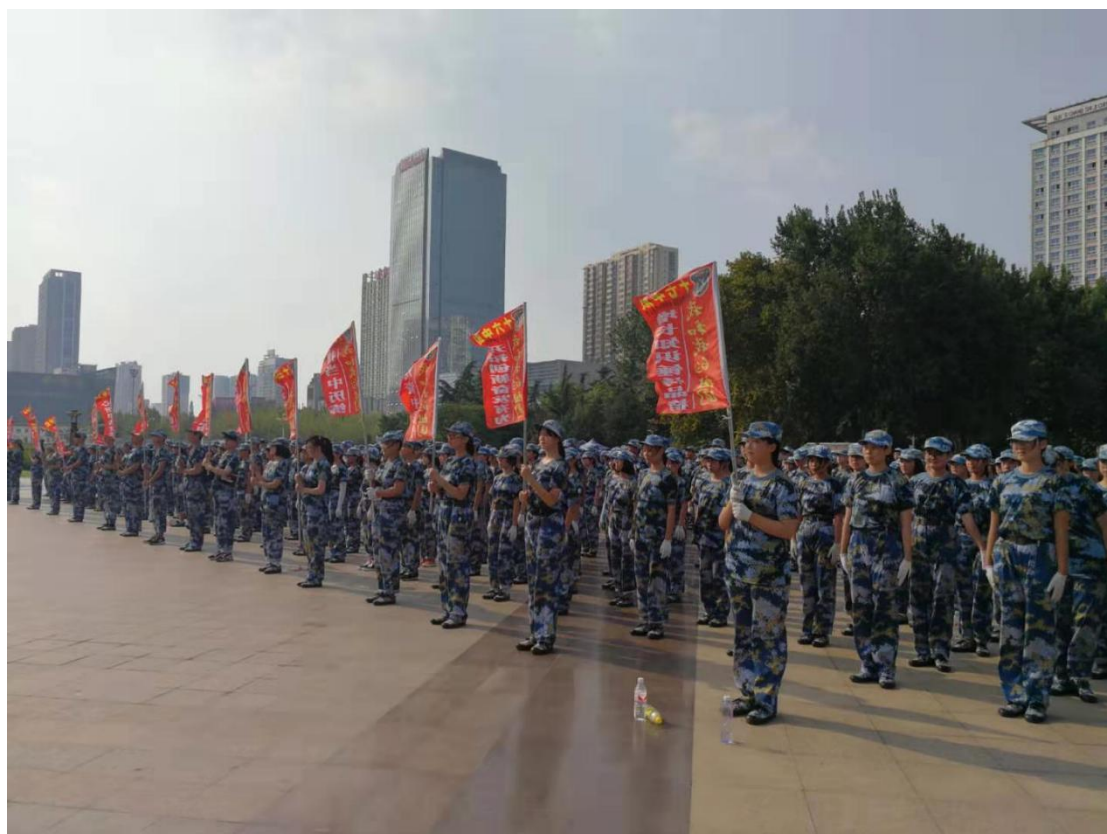
图 3-2: “国旗下成长”活动

教师节开展感恩教育活动,培养学生服务人民的意识;利用国际禁毒日和全国法制宣传日开展实践活动,增强学生遵纪守法的观念等;通过各年级考试纪律教育,培养学生诚实守信的美好品德等。