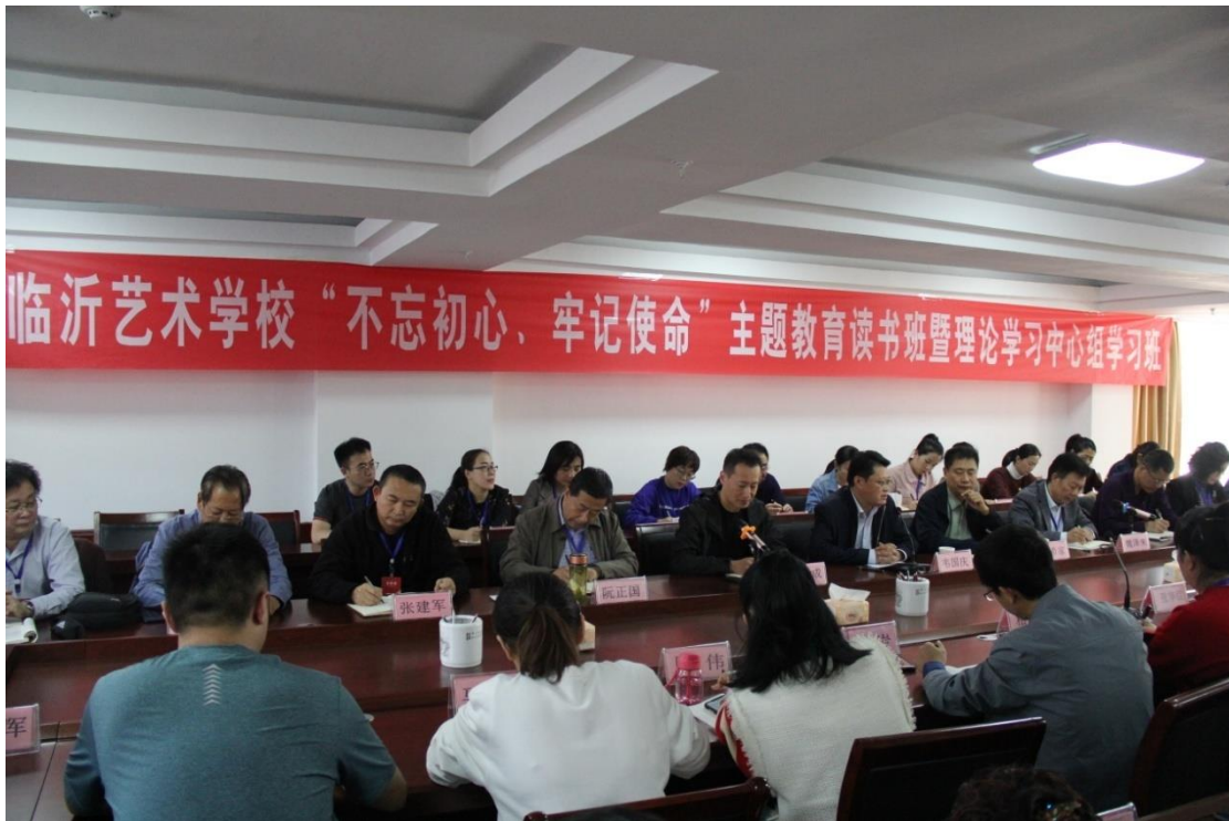
图 3-8：“不忘初心，牢记使命”主题教育活动

四是认真落实“三重一大”会议议事制度。严格执行民主集中制，重大问题严格遵守集体讨论决定，经常开展谈心谈话活动，班子成员、中层干部和普通教职工相互坦诚交流沟通成为常态。学校领导坚持每月走出办公室深入校园课堂，积极主动了解师生需求，掌握学校的基本情况，防范形式主义、官僚主义等“四风”问题的出现。我们还建立了科级干部廉政档案，制定了党员干部的廉政风险点，加强了党风廉政建设。