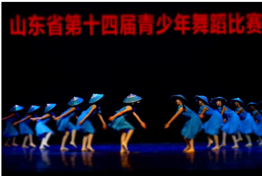
图 5-1：2019 年 6 月 16 日 我校舞蹈节目《心有灵犀》《缅桂花开》参加山东省第十四届青少年舞蹈比赛

针对舞蹈专业社会需求量大，生源也相对较好的实际，先后注入 130 余万元资金，加强了对该专业师资力量的培训以及练功厅和其它教学设施的投入，学生在各项比赛中屡获佳绩，在 2019 年山东省青少年舞蹈大赛中。我校群舞《冕桂花开》获一等奖、群舞《心有灵犀》获二等奖、独舞《小女二八》获一等奖、独舞《傣家小妹》获二等奖；在临沂市职业院校“啦啦操大赛”中街舞获一等奖。舞蹈专业人才培养成果日益凸显。