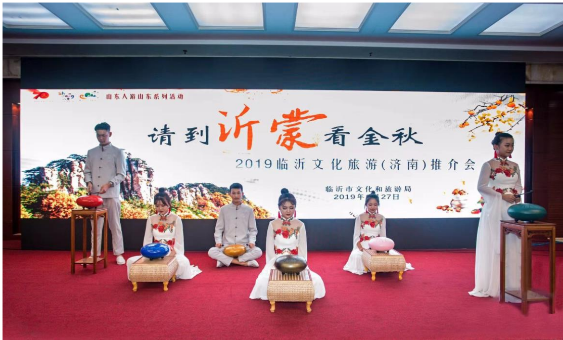
图 7-2：音乐专业空灵鼓节目展演

空灵之声的星火之势。空灵鼓具有体积小、便携带、音色好、易演奏的特点，深受大众的喜爱，在空灵鼓艺术的教学过程中，我们有计划、有目的地编排一些特色的曲目，并将空灵鼓与中国传统乐器相结合，如：编钟、箫、巴乌、古琴、大鼓、营造出带有古代气息的灵动之声，不论从表演者的服饰还是演奏曲目的形式，都会投射出中国古典音乐的阴柔之美。再者空灵鼓也可与现代乐器、歌舞及书法相结合，形成多元化的一种表演形式，不再拘泥于传统的表演结构形式，使空灵之声散发独有的空灵魅力。