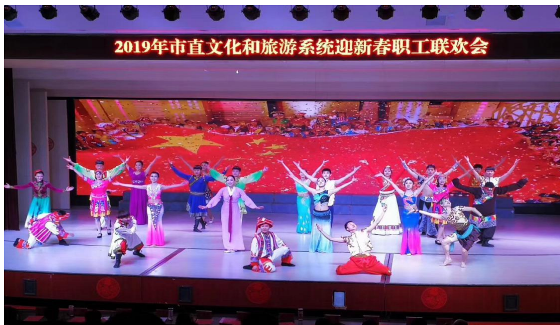
图 5-2：舞蹈表演专业《锦绣中华》演出照

结合柳琴专业人才培养计划，坚持课堂教学与教学研究相结合，课堂教学与舞台实践相结合，普遍培养与重点提高相结合，突出课堂教学、实习彩排、对外演出三位一体的特色育人模式，在艺术传承上发挥了至关重要的作用。