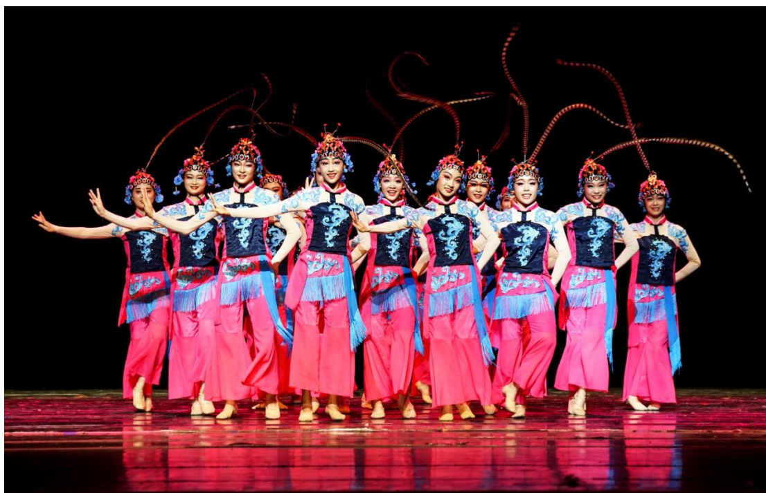
图 5-2：2019 年 6 月 16 日 我校舞蹈节目《心有灵犀》《缅桂花开》参加山东省第十四届青少年舞蹈比赛