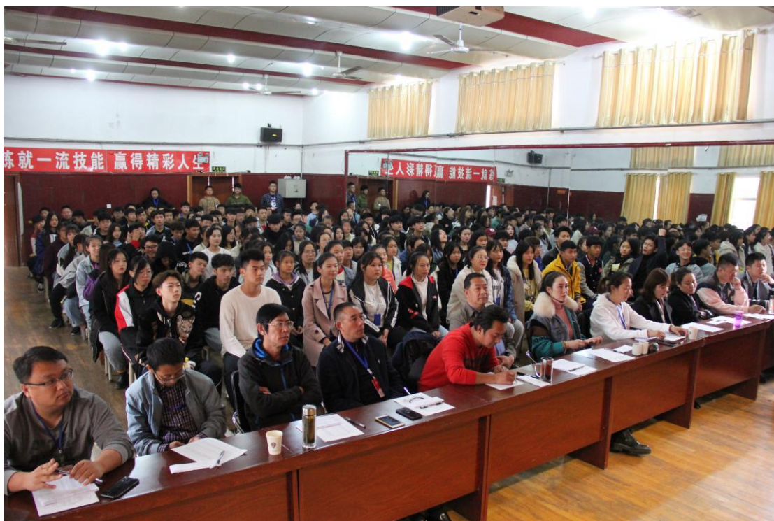
图 2-2：“我和我的祖国”主题征文、演讲比赛