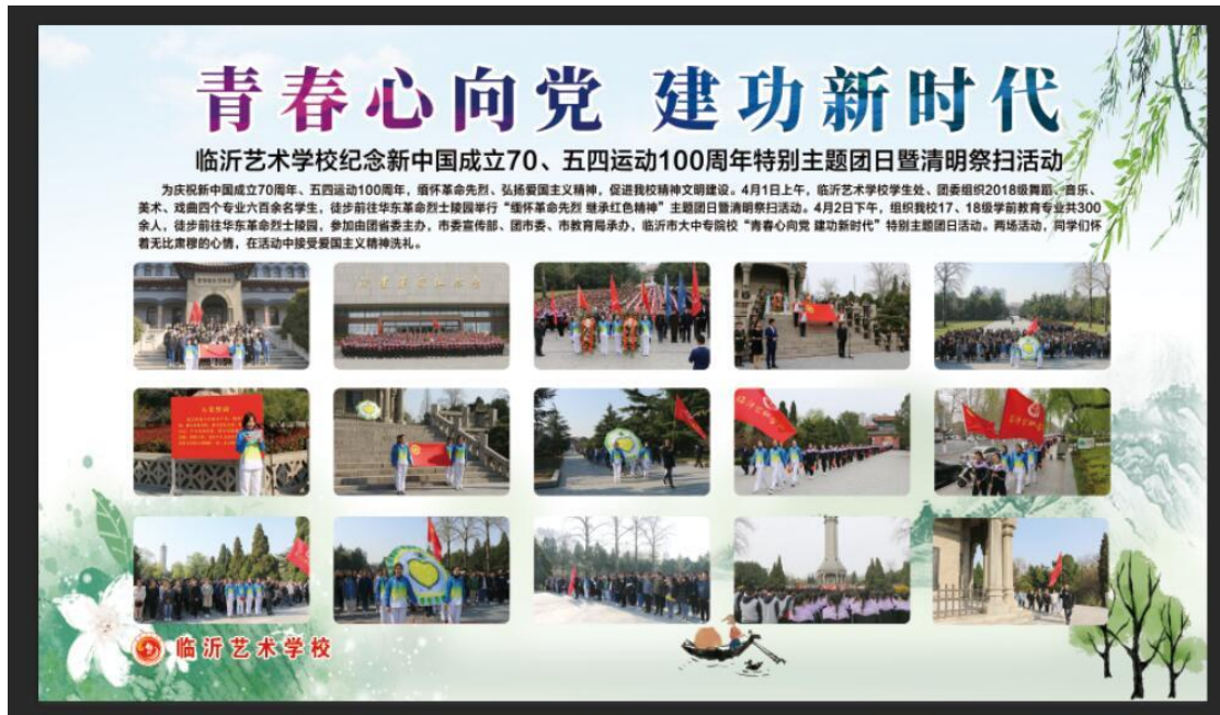
图 2-6：“缅怀革命先烈 继承红色精神”主题团日暨清明祭扫活动