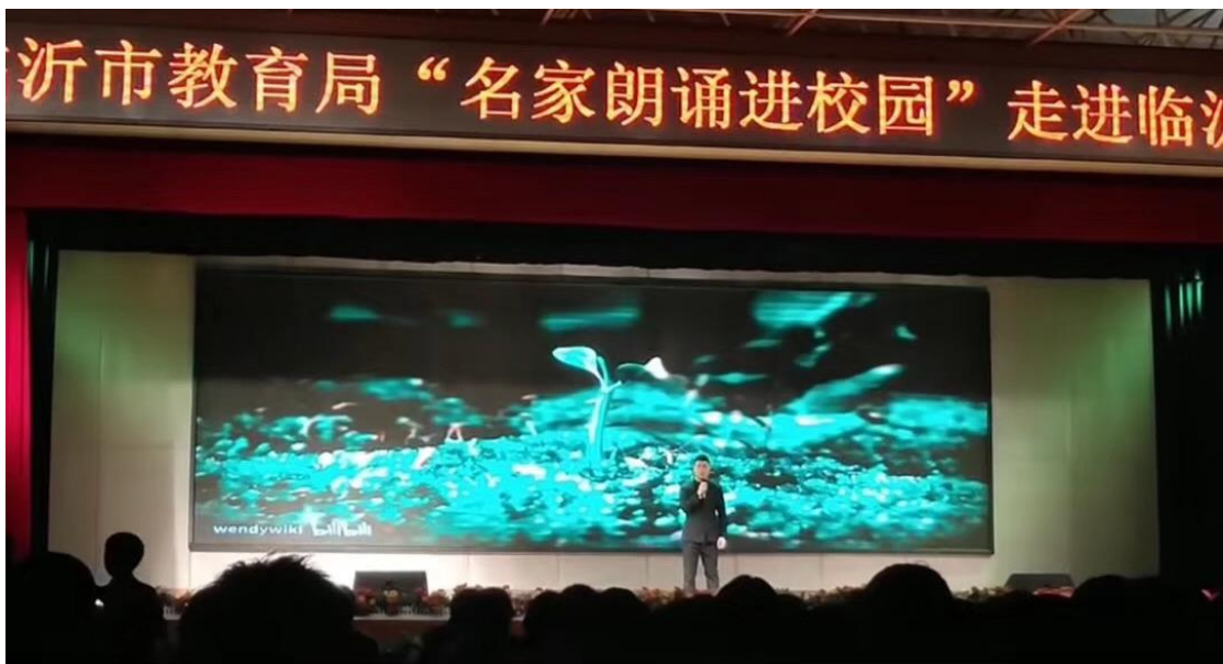
图 5-5：参加市教育局“名家朗诵进校园”活动

在校际帮扶方面，以“职教联盟”为依托，以“职业教育学会”为平台，面向我市五区九县发挥辐射作用，发挥我校专业优势，主动帮助扶持薄弱学校薄弱专业，为我市职业教育的发展发挥了引领作用。