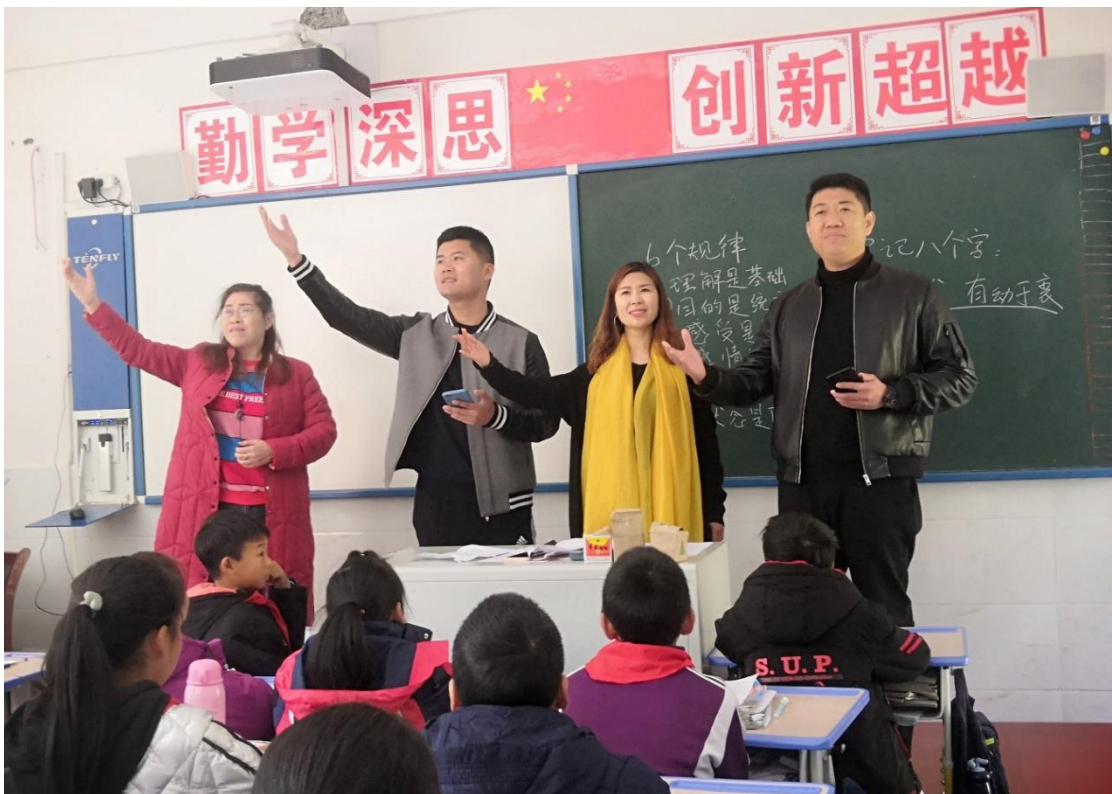
图 5-8：临沂市教育局名家朗诵团赴重庆城口县 7 所学校送教活动