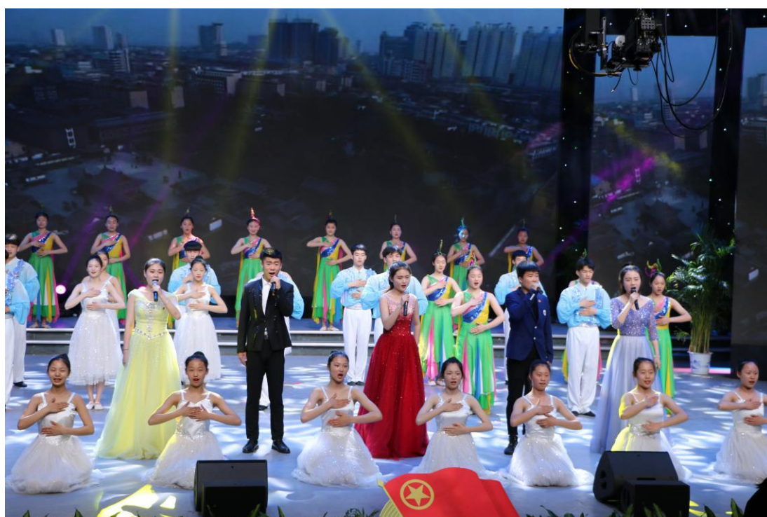
图 3-4：团组织参加志愿演出活动