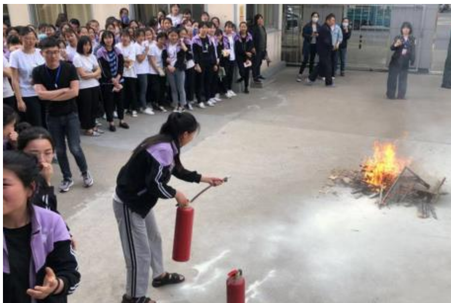
图 2-10：消防安全演练活动