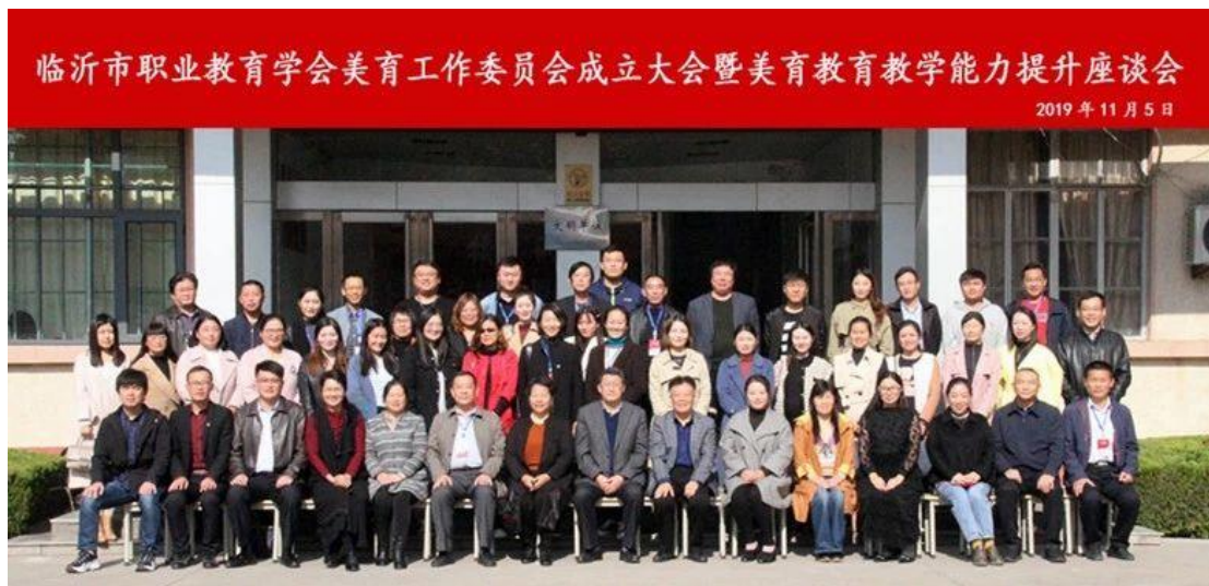
图 5-1：临沂市职业教育学会美育工作委员会成立

育的特色，舞蹈表演、音乐、美术绘画专业、学前教育专业常年开设各类培训，并且成为各类培训认证部门的首选基地，为此学校建立了各专业培训课程资源库，并且根据教学实际和培训实际不断调整补充资源库内容。近年来我校为社会培养了大批紧缺人才和社会所需人才，并在各项社会活动中发挥了积极的作用。据统计，本年度学校培训人次已达 600 人；其次，我校优秀的教学资源吸引了临沂市许多企业前来我校参加员工培训活动，如临工集团、临沂市蒙山沂水演艺公司等等。通过我校的培训，极大地提高了企业员工的艺术素养，丰富了企业员工的业余生活；在此基础上，我市许多品牌企业都将我校定为区域公共实训中心，如蒙山沂水演艺公司、临工集团、双星集团等品牌企业；此外，临沂市很多县区的各类学校也将我校定为教师进修基地。