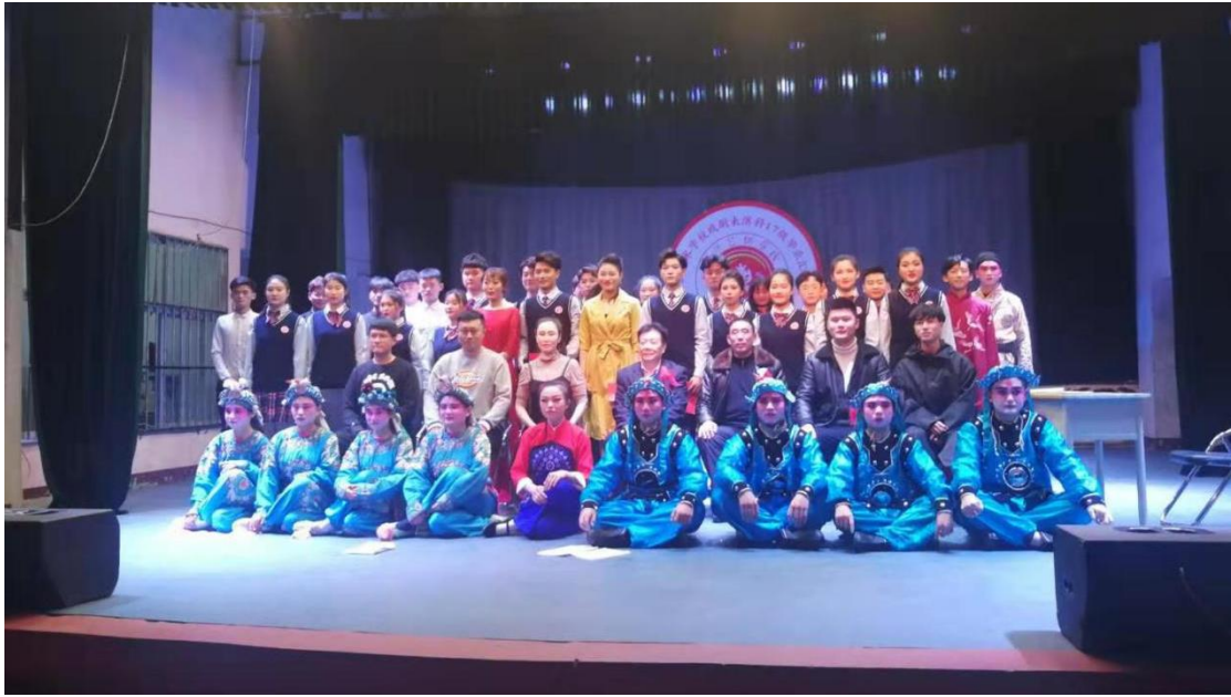
图 5-4：戏曲表演专业毕业演出