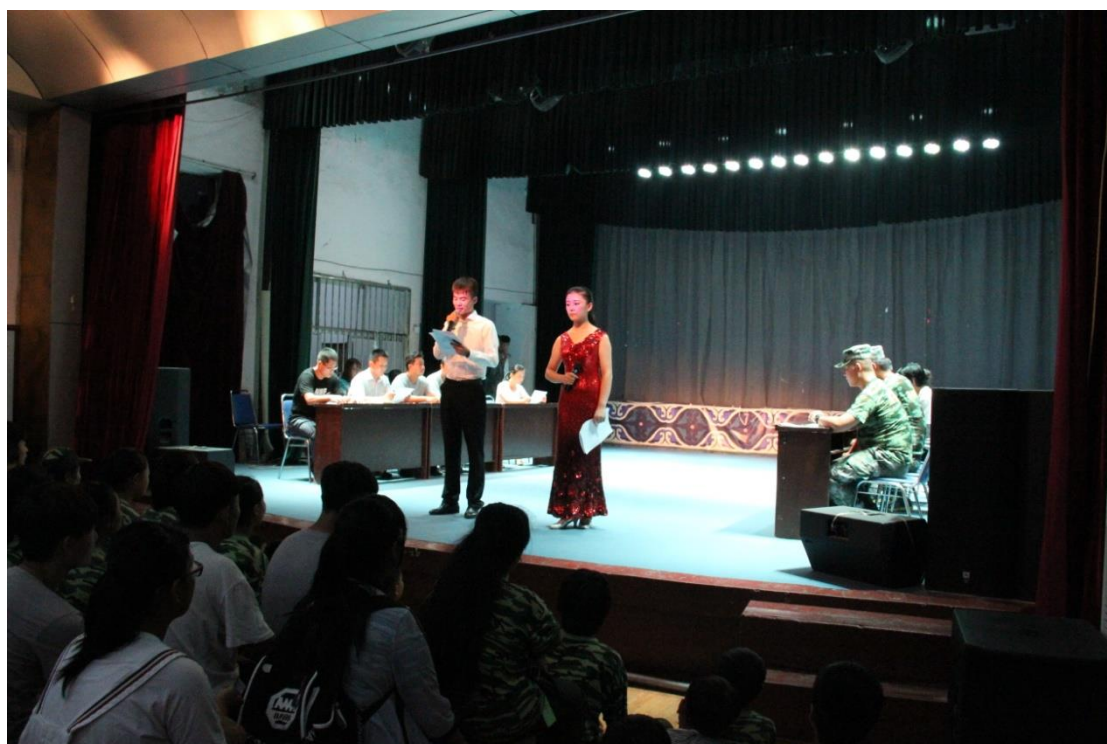
图 2-1：“抵制校园伤害，共建和谐校园”演讲比赛

殊荣。同时，学校强化服务理念，做好后勤、安保等服务工作，积极解决师生在学习、生活中遇到的困难和问题。加大安全监管力度，建设平安校园，未发生重大安全责任事故。通过发放调查问卷统计，学生对校园文化与社团活动的满意度 95%，生活满意度 95%，校园安全满意度 99%，毕业生对学校的满意度 98%。