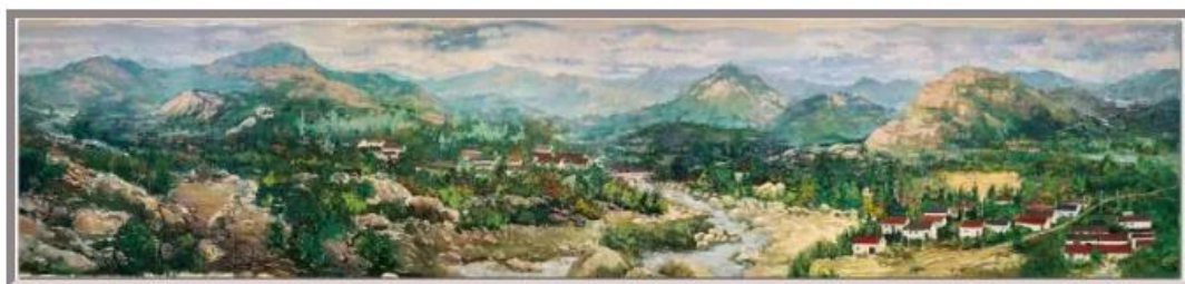
图 5-4：“践行沂蒙精神，绘就家乡风采”美术专业教学实践活动

今年我校成功举办“壮丽 70 年 奋斗新时代”临沂艺术学校庆祝新中国成立 70 周年专场文艺演出，学校人才培养成果得到社会普遍认可。