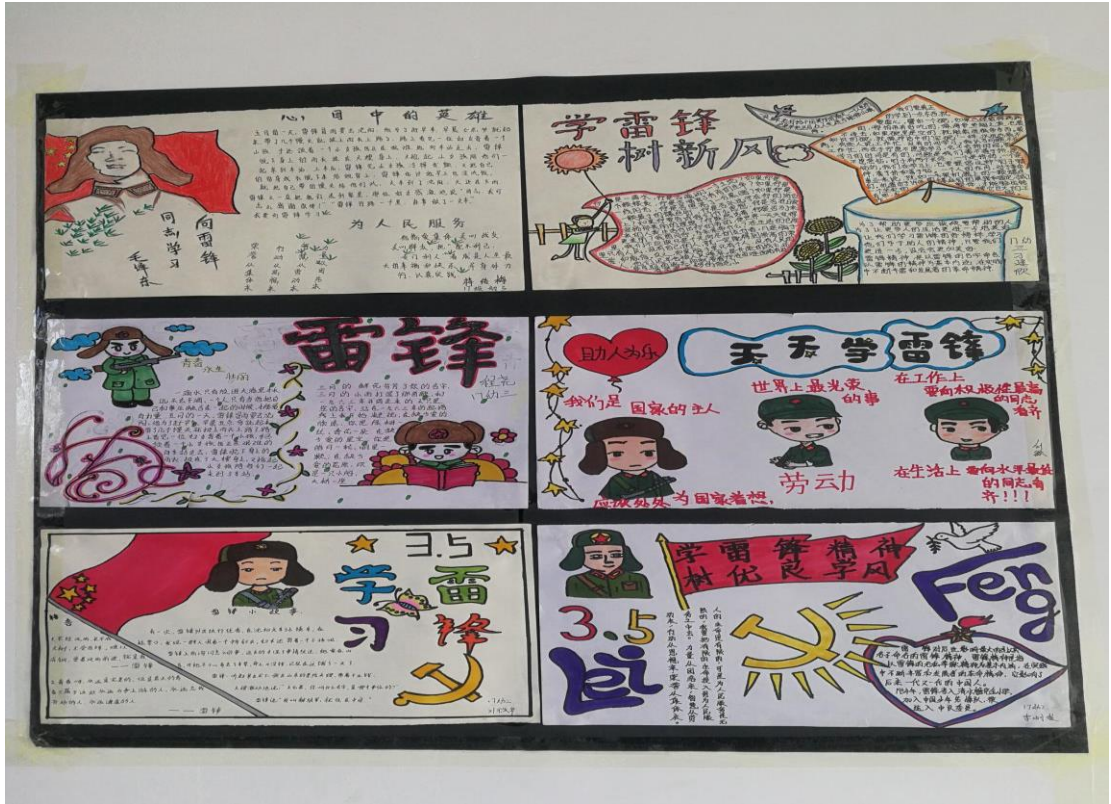
图 2-8：学雷锋主题活动