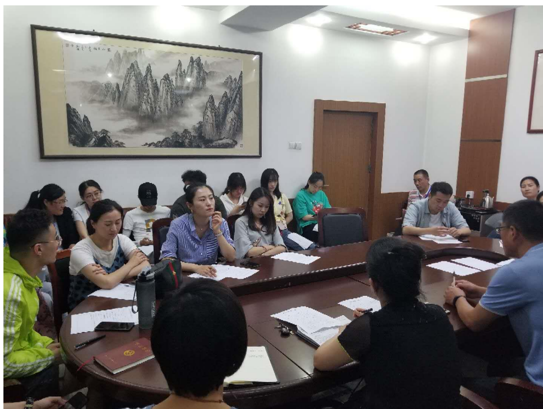
图 2-5：防溺水工作落实会