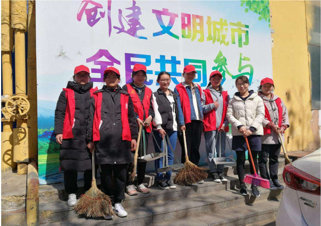
图 3-5：参加志愿服务活动